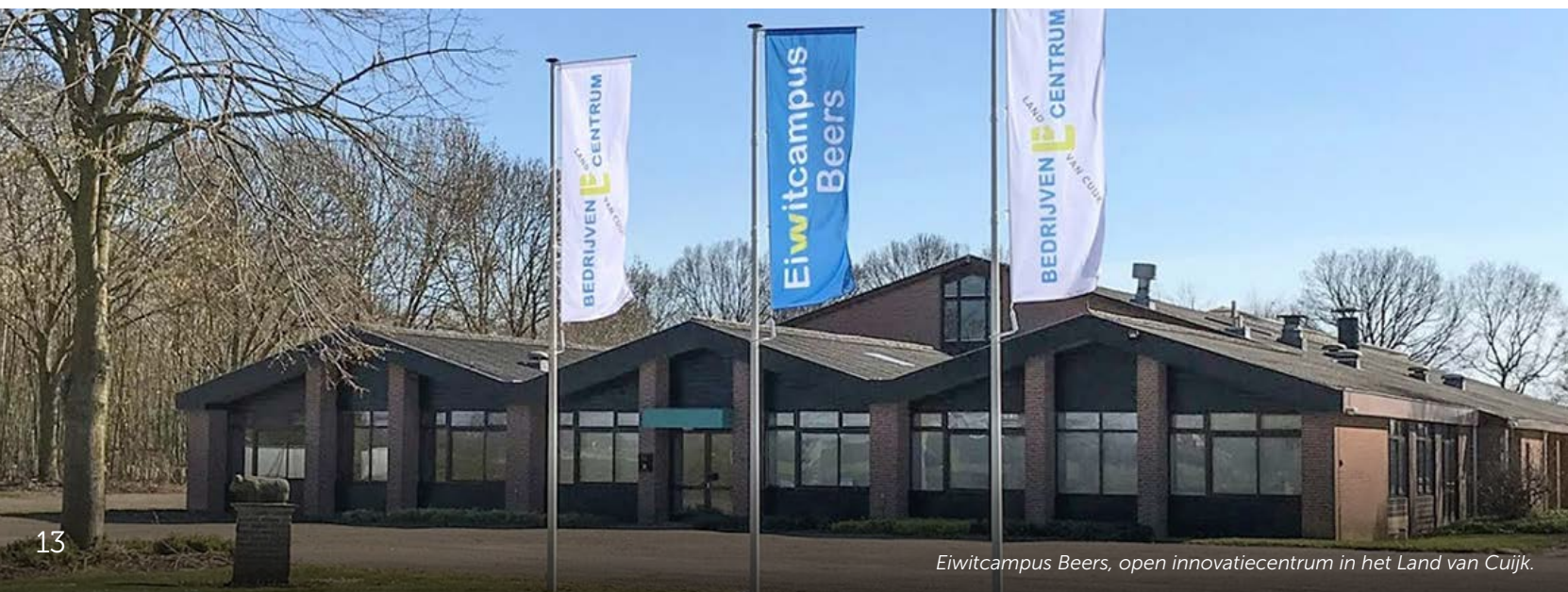
Eiwitcampus Beers, open innovatiecentrum in het Land van Cuijk.

Start Foodtour Land van Cuijk (Regio Deal)