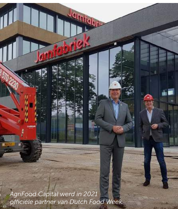
AgriFood Capital werd in 2021 officiële partner van Dutch Food Week.