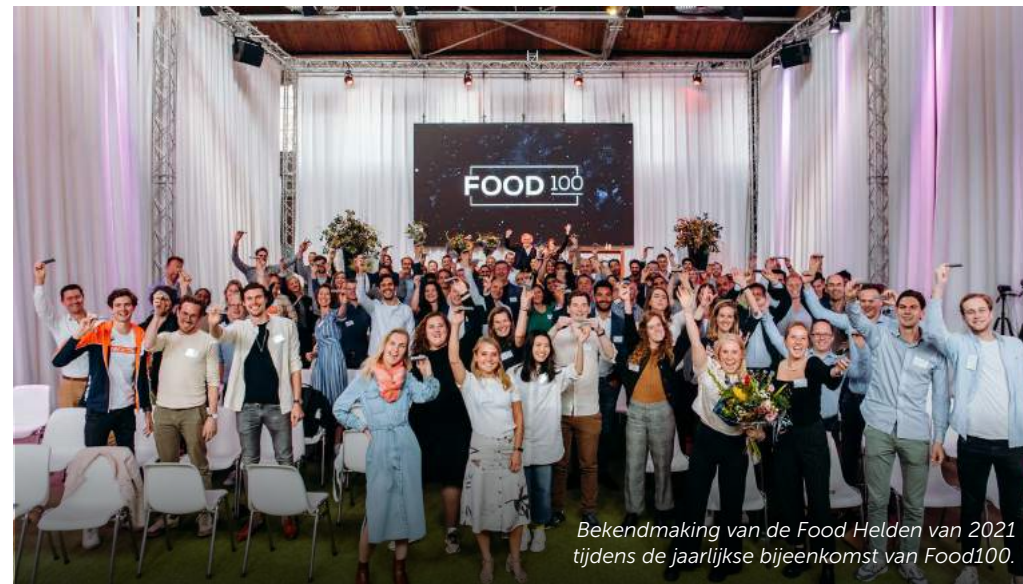
Bekendmaking van de Food Helden van 2021 tijdens de jaarlijkse bijeenkomst van Food100.

we het Bossche bedrijf PeelPioneers een waardevol podium hebben kunnen geven. Zij verwerken sinaasappelschillen, onder meer afkomstig uit de horeca, tot waardevolle nieuwe grondstoffen. In oktober vond op de Noordkade in Veghel de Trendsummit plaats met als thema Do.Great.Things. Het werd een dag vol goede energie, inspiratie en gave inzichten voor de toekomst van voedsel en gastvrijheid. Daarnaast maakten we samen met Food Inspiration zeven verhalen van bijzondere voedselmakers uit onze regio.