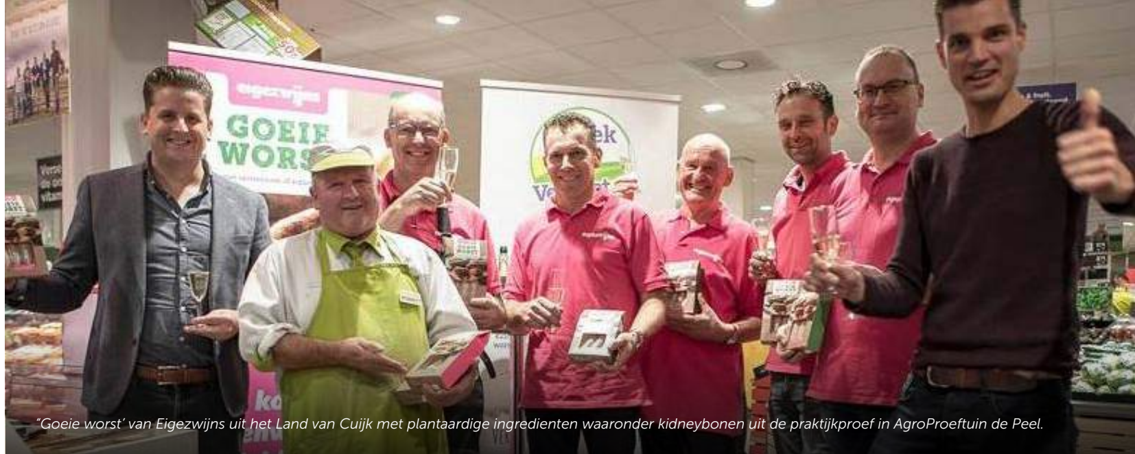
"Goeie worst" van Eigezwijs uit het Land van Cuijk met plantaardige ingrediënten waaronder kidneybonen uit de praktijkproef in AgroProeftuin de Peel.