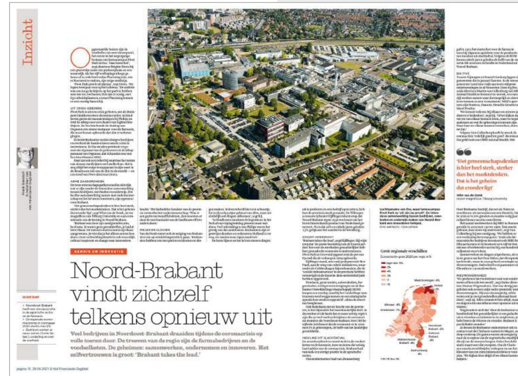
Artikel over ondernemerschap in en veerkracht van Noordoost-Brabant i.s.m. AgriFood Capital.

Gezamenlijke oproep aan het nieuwe kabinet om door te gaan met ondersteuning van de regio's (Regio Deals)