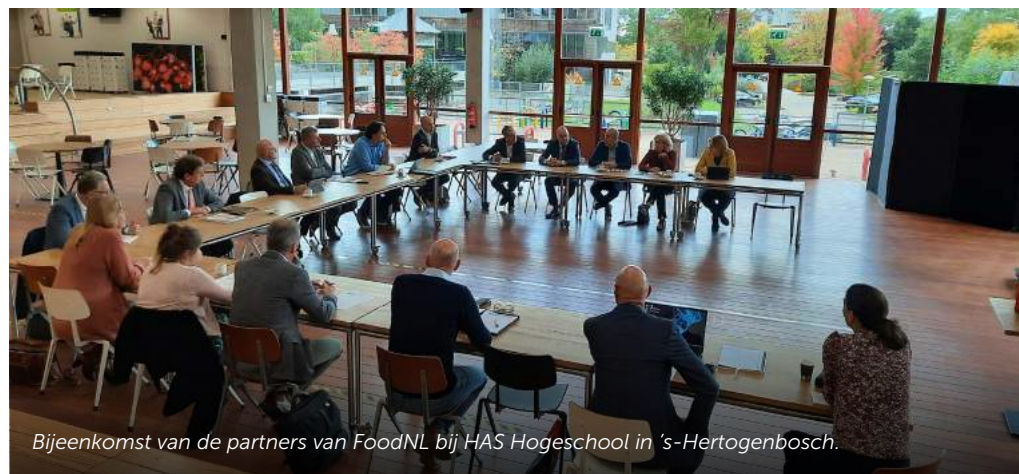
Bijeenkomst van de partners van FoodNL bij HAS Hogeschool in 's-Hertogenbosch.