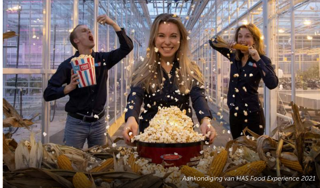
Aankondiging van HAS Food Experience 2021