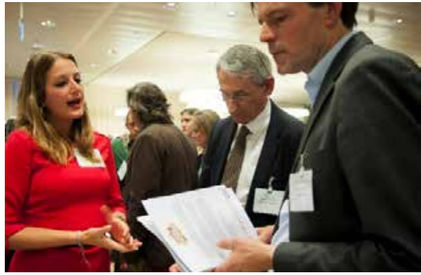
Presentatie Foodsquad bij Business Dag Food for Health, 2014