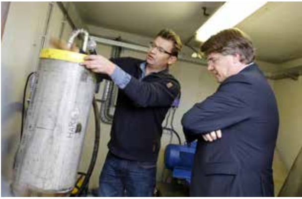
Start Greentech Pilot One in Boxtel, oktober 2014