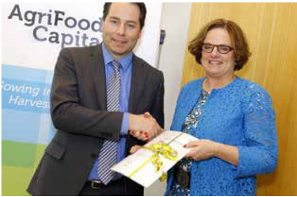
Overhandiging rapport #breedbandBrabantbreed aan Regio Noordoost-Brabant, april 2015