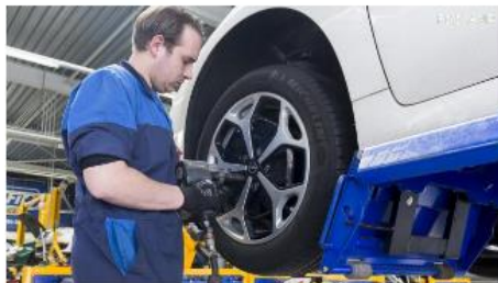
Recordaantal autobedrijven kampt met tekort aan personeel