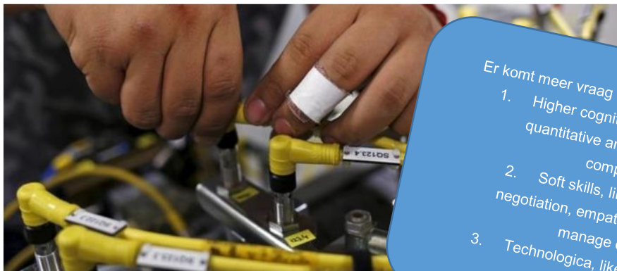
The age of automation will bring about a fundamental shift in the skills required for people to enter the workforce