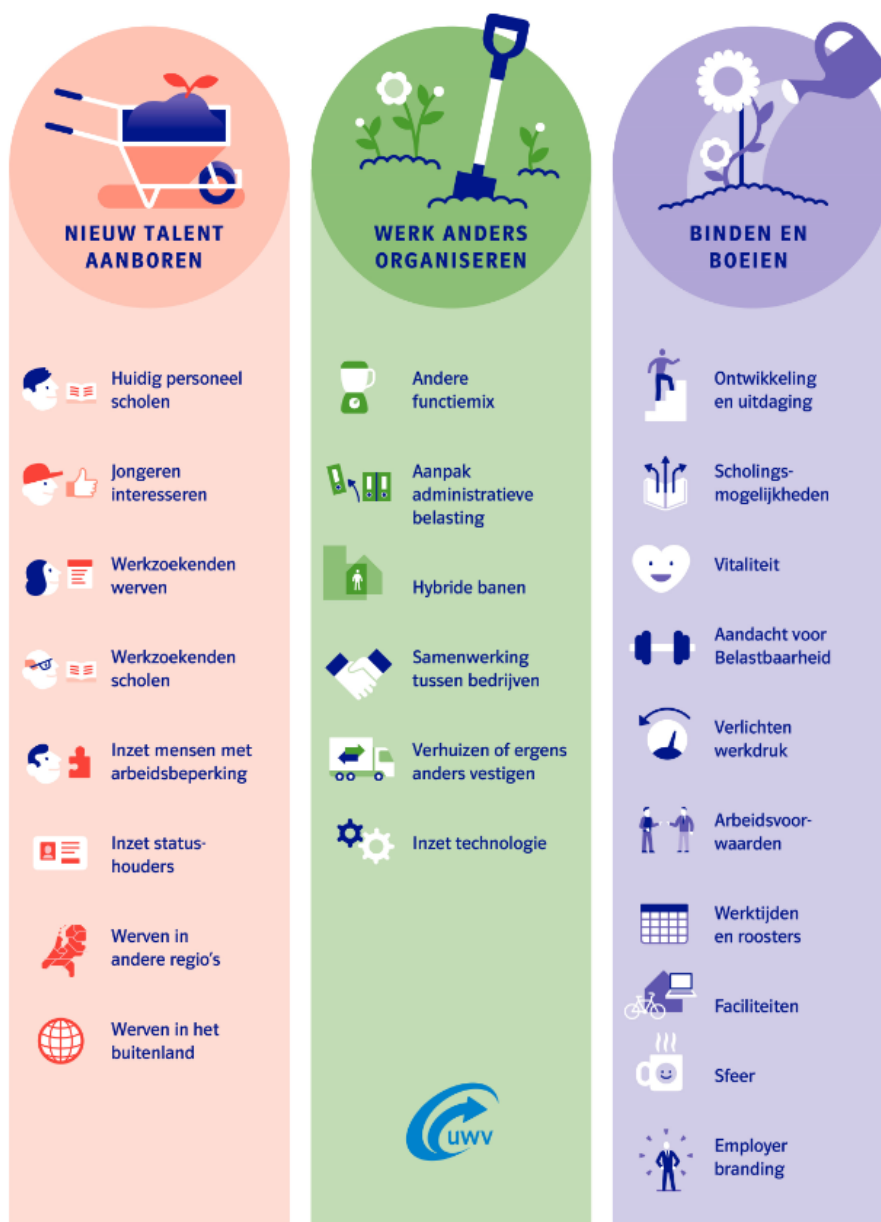
Afbeelding 6 Oplossingen personeelstekorten voor werkgevers

Het verkleinen van de mismatch vereist echter ook een inspanning van werkgevers. Zij kunnen kijken naar snelle oplossingen, zoals intensiever werven en het aanpassen van functie-eisen. Een effectieve manier om meer kandidaten te werven door functie-eisen aan te passen, is door alleen te selecteren op de belangrijkste taken die bovendien moeilijk aan te leren zijn. Er zijn ook alternatieve mogelijkheden, die in veel gevallen een grotere inspanning vragen. Afbeelding 6 toont deze oplossingen, onderverdeeld in drie categorieën: aanboren van nieuw talent, anders organiseren van werk en binden en boeien van personeel. Scholing en ontwikkeling staan bij veel van deze oplossingen centraal. Goede samenwerking tussen werkgevers, UWV, gemeenten, onderwijs en/of andere partijen is hierbij vaak cruciaal.